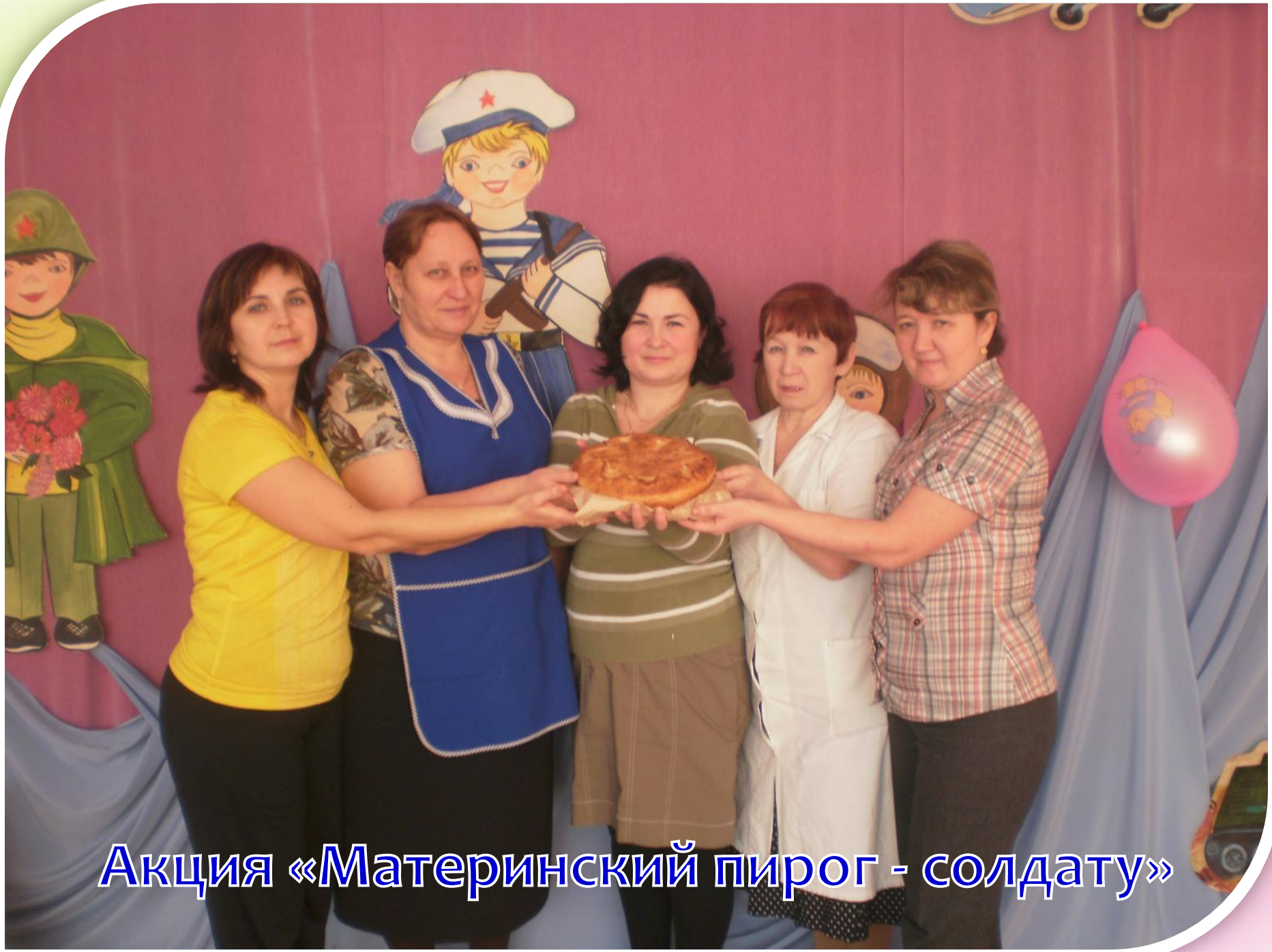
Акция «Материнский пирог - солдату»